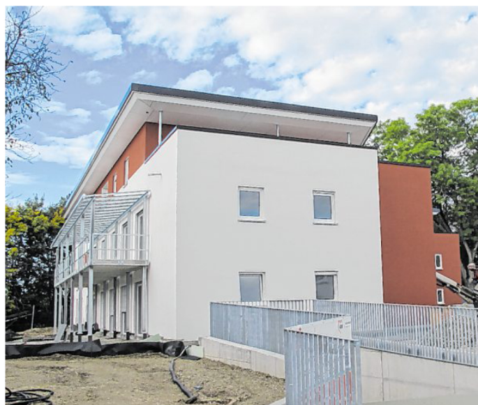
Im Herzen von Mertingen ist die neue Anlage für Betreutes Wohnen der AWO entstanden. Am Sonntag, 15. Oktober, von 13 bis 17 Uhr, sind alle Interessierten zum Tag der offenen Tür eingeladen.