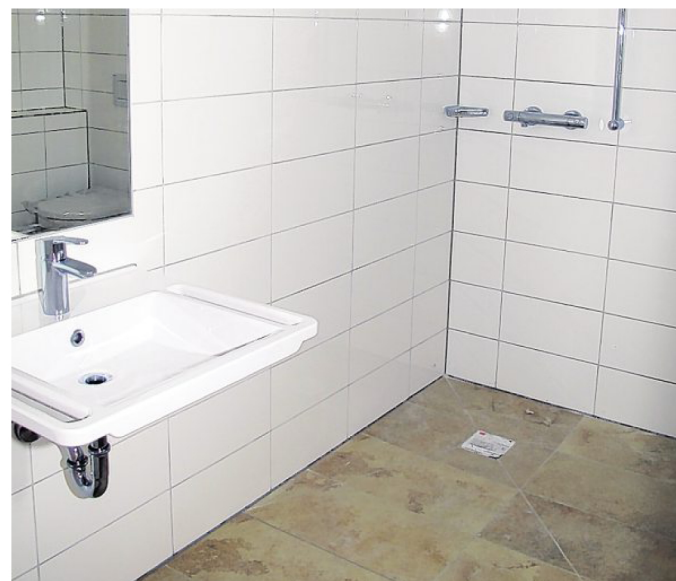
Alle 19 Mietwohnungen des neuen Gebäudes sind mit barrierefreien Bädern ausgestattet, in die eine bodengleiche Dusche eingebaut ist.