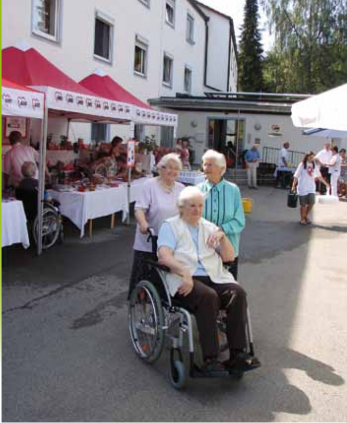
Bewohnerinnen des AWO-Seniorenheims Krumbach