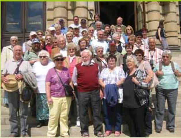
Reisegruppe des OV Bad Wörishofen/Mindelheim in Prag