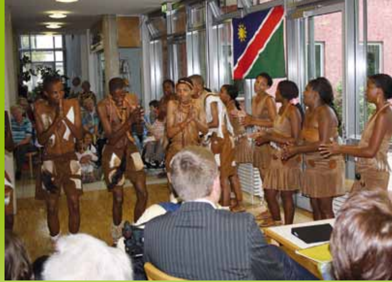
Der afrikanische Gospelchor „Thlokomela“