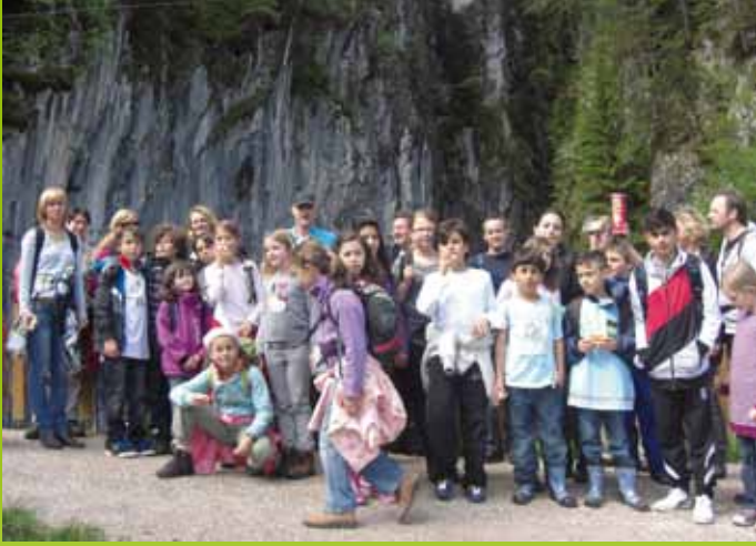
Kinder, Eltern und Mitarbeiterinnen des Hortes