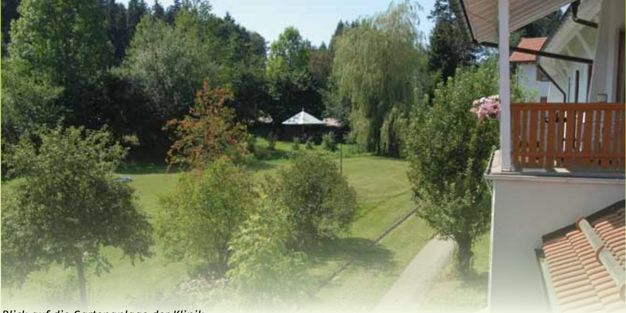
Blick auf die Gartenanlage der Klinik