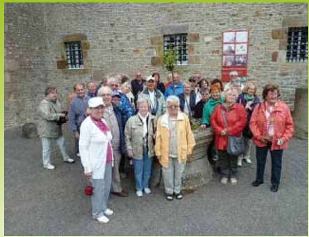
Die Kissinger AWO in Frankreich